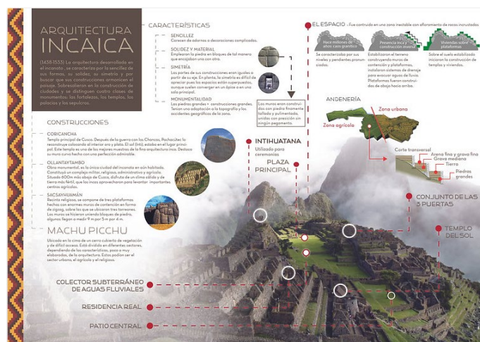
Figura 4. Modelo de Infografía