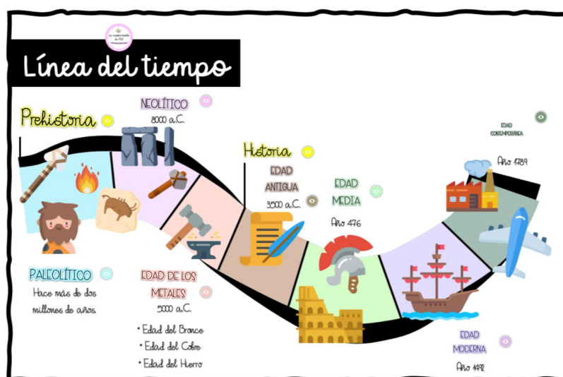
Figura 2. Línea de Tiempo en Genially