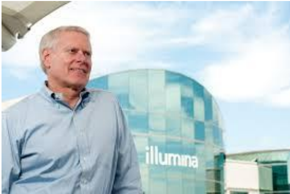
Jay T Flatley

Empresa líder en tecnologías para el análisis a gran escala de la variación genética