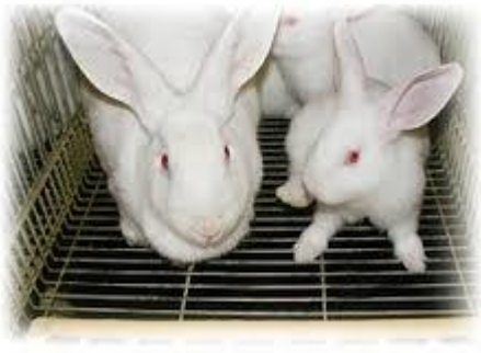
Conejos albinos raza New Zelanda