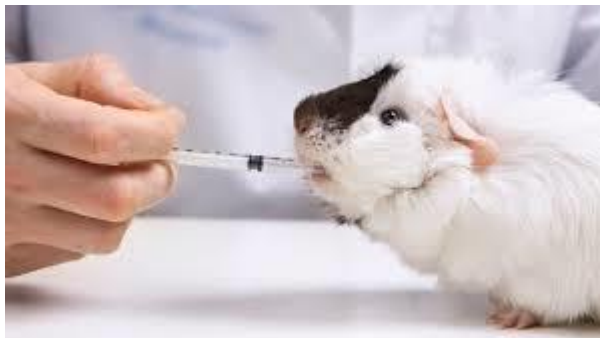
Cuyo o cobayos raza mestiza