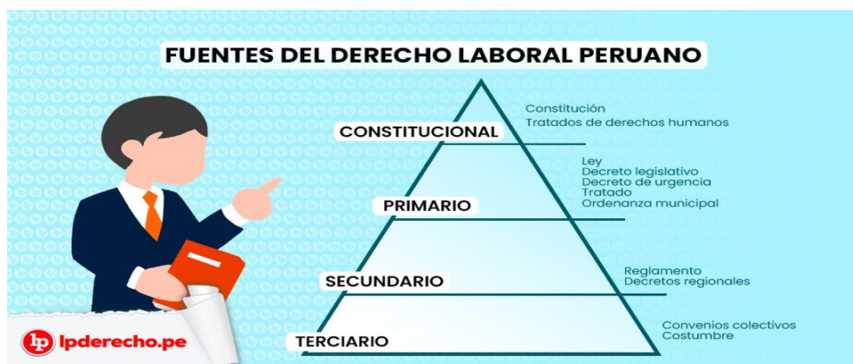
Figura 1. Fuentes del derecho laboral peruano