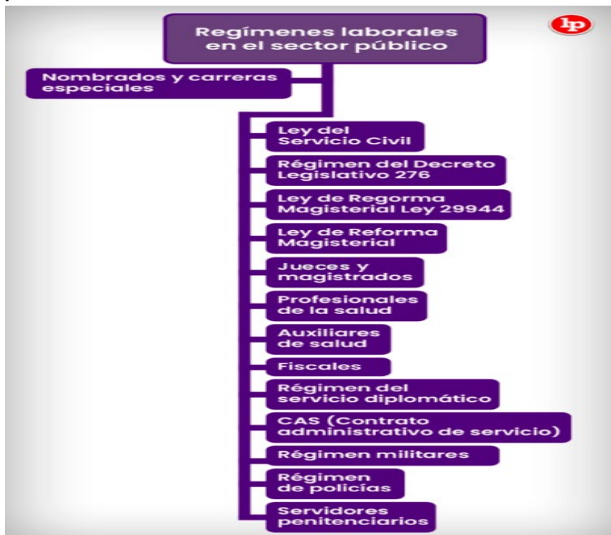
Figura 2. Regímenes laborales en el sector público