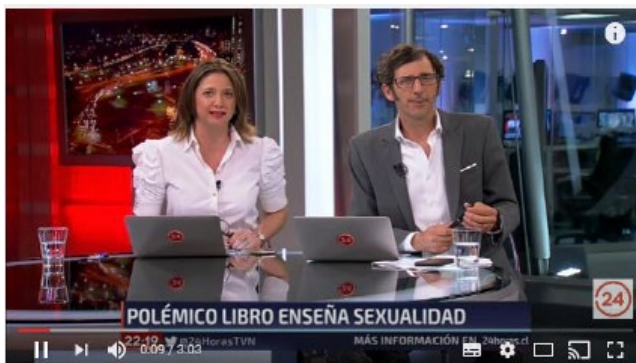
Polémica por libro de sexualidad adolescente: ¿Realista o explícito?

En Chile, se publicó no hace mucho un libro dirigido a brindar información sobre sexualidad a adolescentes en escuelas de la capital. El libro fue construido en base a las principales dudas y necesidades de conocimiento que manifestaron los mismos adolescentes. Esta pequeña nota periodística levanta algunas posturas y opiniones sobre cuál debería ser el papel de la educación y si debiera haber límites en la información que transmite.