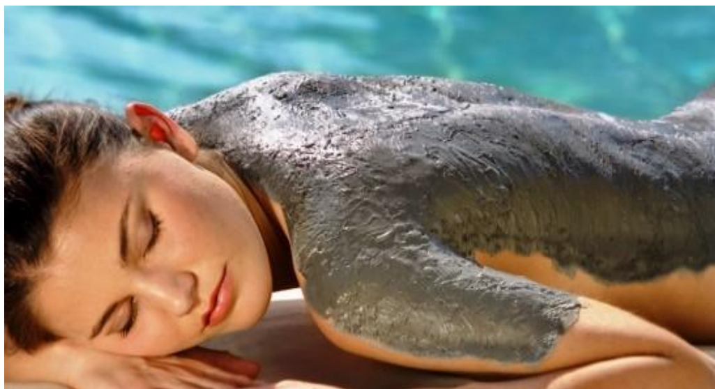
Gráfico 5. La geoterapia