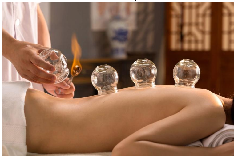
Gráfico 4. Prácticas de masaje