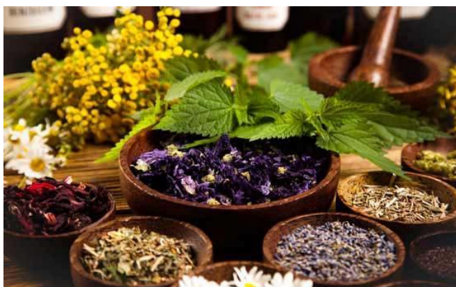
Gráfico 4. Fitoterapia