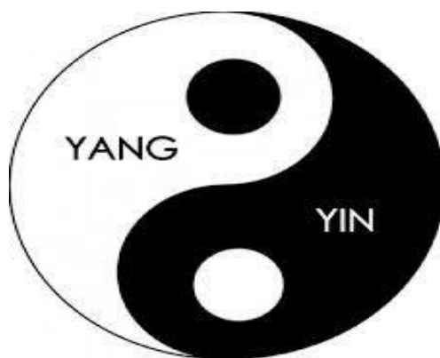
Gráfico 1. Símbolo de la teoría del Tao